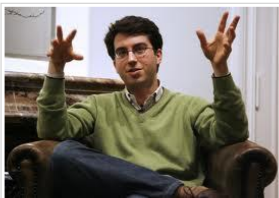
Jonathan Safran Foer, uno degli scrittori ospiti della manifestazione