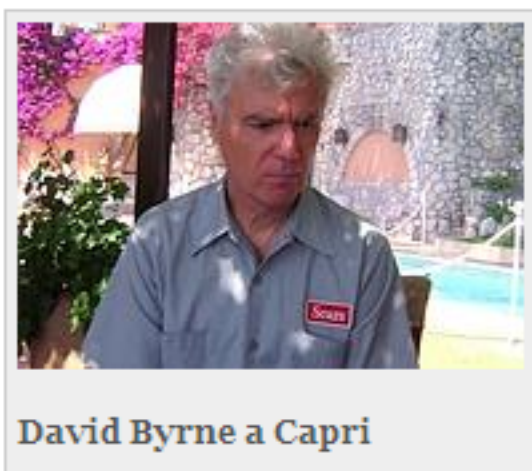
David Byrne a Capri

A Capri c'è David Byrne, il mitico cofondatore dei Talking Heads, il musicista — inglese di nascita americano d'adozione — che, dalla collaborazione con Brian Eno alle incursioni nei ritmi sudamericani al più recente progetto su Imelda Marcos con Fatboy Slim, ha saputo comporre una colonna sonora fra le più lunghe e coinvolgenti degli ultimi trent'anni e passa. Stasera sarà alle Conversazioni di Tragara con il regista Paolo Sorrentino, per il quale ha composto le musiche del nuovo film, interpreti Sean Penn e Frances McDormand, il cui titolo è del resto proprio quello di una famosa canzone dei Talking Heads: «This Must Be the Place». E il posto giusto è anche Capri, dove Byrne si confronterà con il tema, comune a tutti gli incontri, dei diritti umani, benché sia prevedibile che si parli anche del suo nuovo libro Diari della bicicletta , appena uscito per Bompiani. Della bici Byrne è un cultore devoto: tanto che è riuscito a infilarla pure nel suo testo sui diritti umani. «Sono andato in bici anche per le strade di Napoli», rivela Byrne, che in città si è esibito almeno tre volte. «Certo non è una cosa facile: ti tocca di evitare le salite e ci sono un sacco di macchine e di motorini, anche se va detto che quando il traffico è così pesante l'adrenalina ti mantiene sveglio e vigile. Certi giorni, però, fa davvero troppo caldo per pedalare».