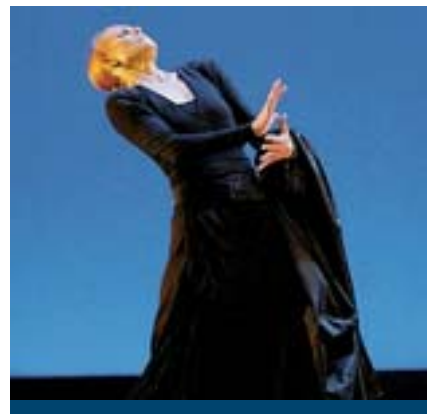
Riflettori puntati su «Blue Lady» e «Giotto», omaggio a Carolyn Carlson