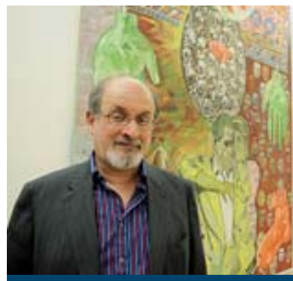
Salman Rushdie, protagonista della rassegna «Le conversazioni»