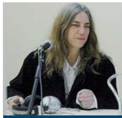
Anche Patti Smith prenderà parte alla kermesse che si svolgerà fino al 5 luglio