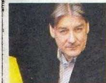
PATRICK MCGRATH L'autore di "Trauma", "Port Mungo", "Martha Peake" e "Follia" sarà a Capri domenica