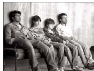
Una scena del film

Sullo sfondo c'è la Città del Messico del 1999, frenetica, con i suoi 20 milioni di abitanti: un enorme buco nero che inghiotte la noia, le disuguaglianze sociali, le lotte studentesche, gli amori che nascono già fragili e le vite che si smarriscono perché non trovano un senso.