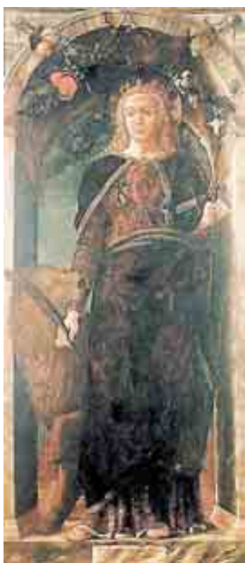
«Sant' Eufemia» Un meraviglioso dipinto di Andrea Mantegna custodito al museo di Capodimonte

«Tuttavia - nota il curatore - ancora ai primi del Novecento nella chiesa fiorentina di San Michele a San Salvi si vedevano antichi dipinti su tavola utilizzati come battenti per la finestra del campanile. Eppure, già sul finire del Settecento, la riscoperta del Medioevo anche sotto il profilo spirituale aveva individuato nelle pitture dei primitivi il se-